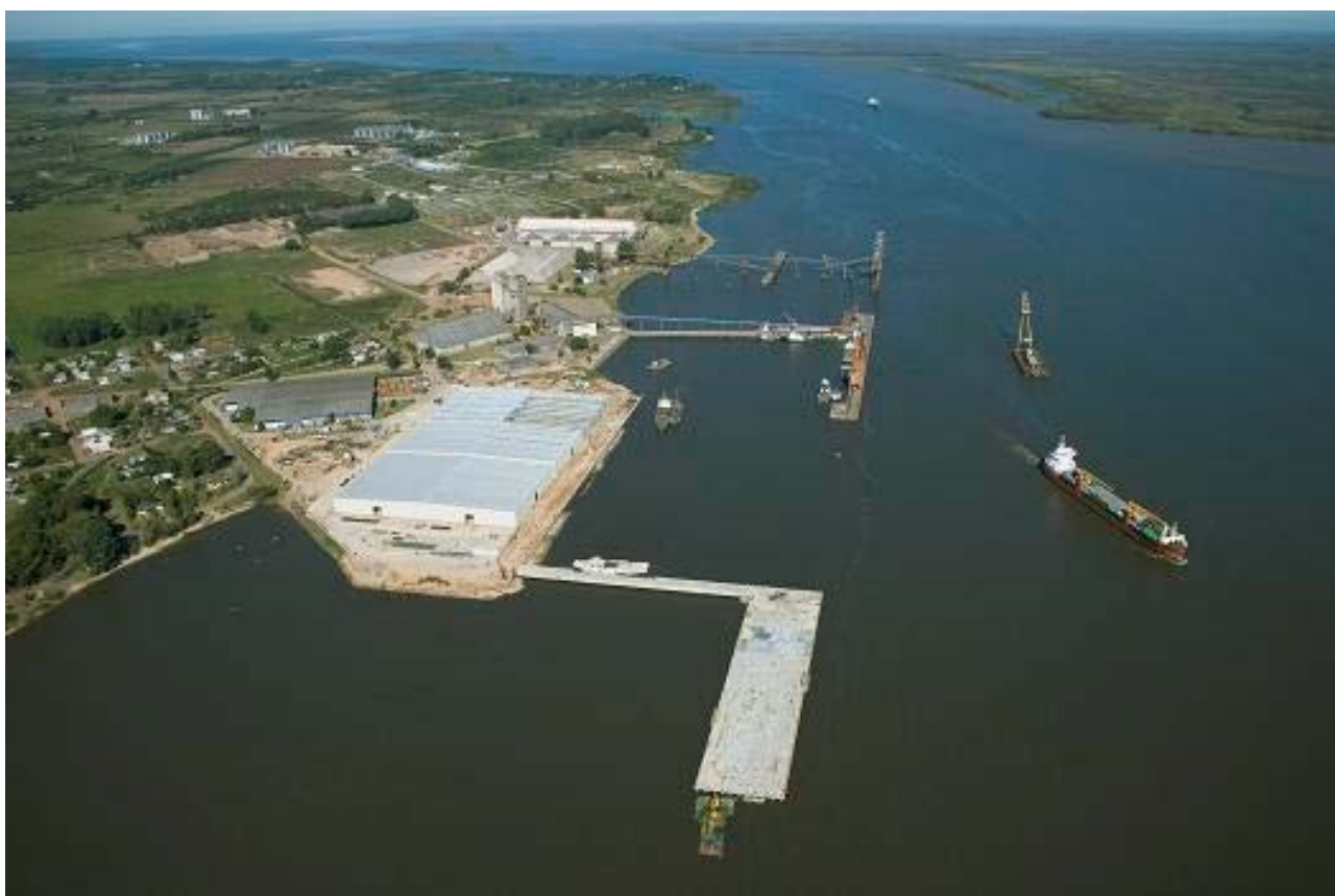
Ontur – Nueva Palmira – Uruguay